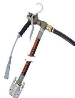
420058 Zargomat pro