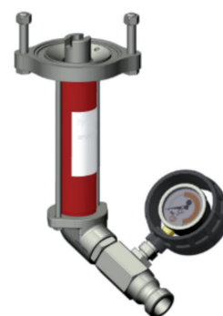
613021 B4-2 (rechtsdraaiend)