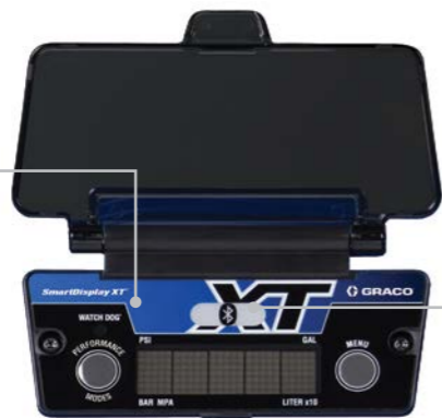
SmartDisplay XT 20B432