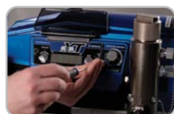
1. Installeer SmartDisplay XT in enkele seconden