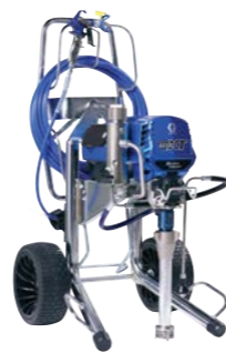
695 XT-1095 XT ProContractor-serie SmartDisplay XT inbegrepen