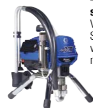
490 XT-1095 XT standaardserie Vereist aankoop van SmartDisplay XT om verbinding te maken met spuittoestel