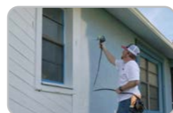
3. Ervaar airless als nooit tevoren