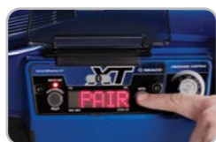
2. Koppel het pistool aan het spuittoestel met één druk op de knop